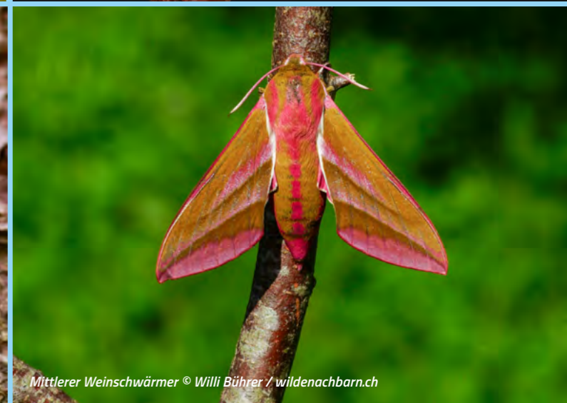
Mittlerer Weinschwärmer