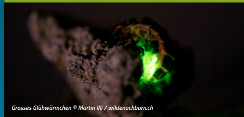
Grosses Glühwürmchen