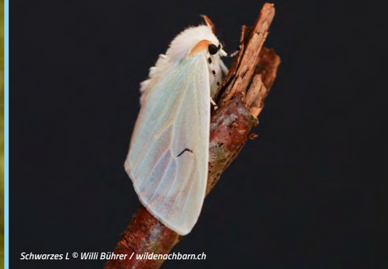
Schwarzes L