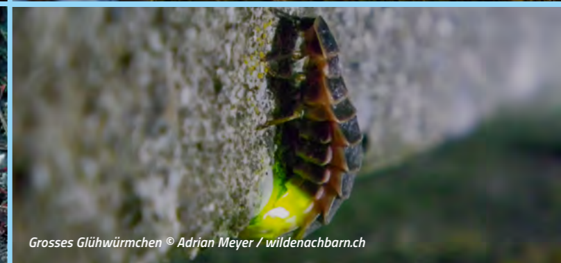
Grosses Glühwürmchen