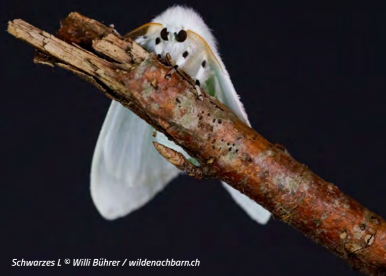
Schwarzes L

Wenn Sie Wildtiere sichten, können Sie diese auf der Meldeplattform zimmerberg.wildenachbarn.ch melden und damit einen Beitrag zu deren Schutz leisten.