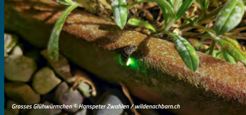
Grosses Glühwürmchen

Obwohl das Grosse Glühwürmchen seltener geworden ist, lässt es sich doch immer noch beobachten. Die Leuchtzeit der Weibchen fällt meist in den Zeitraum von Juni bis Juli und dauert etwa vier Wochen. Dabei kann man die Glühwürmchen am besten an dunklen Stellen in Parkanlagen, alten Gärten, an Waldrändern oder in der Nähe von Feuchtgebieten in Bodennähe beobachten. Sie leuchten hauptsächlich von Sonnenuntergang bis etwa Mitternacht.