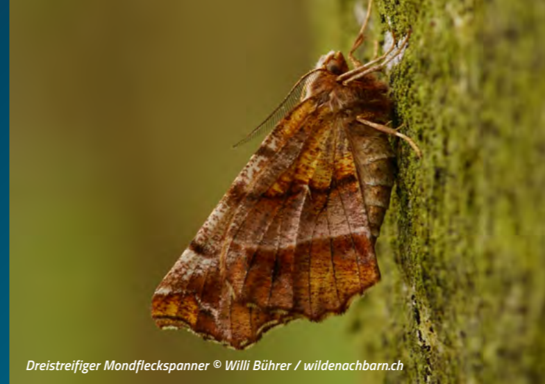
Dreistreifiger Mondfleckspanner

Nachtfalter lassen sich besonders gut an warmen, trockenen Abenden ohne Vollmond beobachten. Wer einen naturnahen Garten hat oder an Waldrändern, Wiesen oder Feuchtgebieten unterwegs ist, kann mit etwas Geduld viele Arten entdecken.