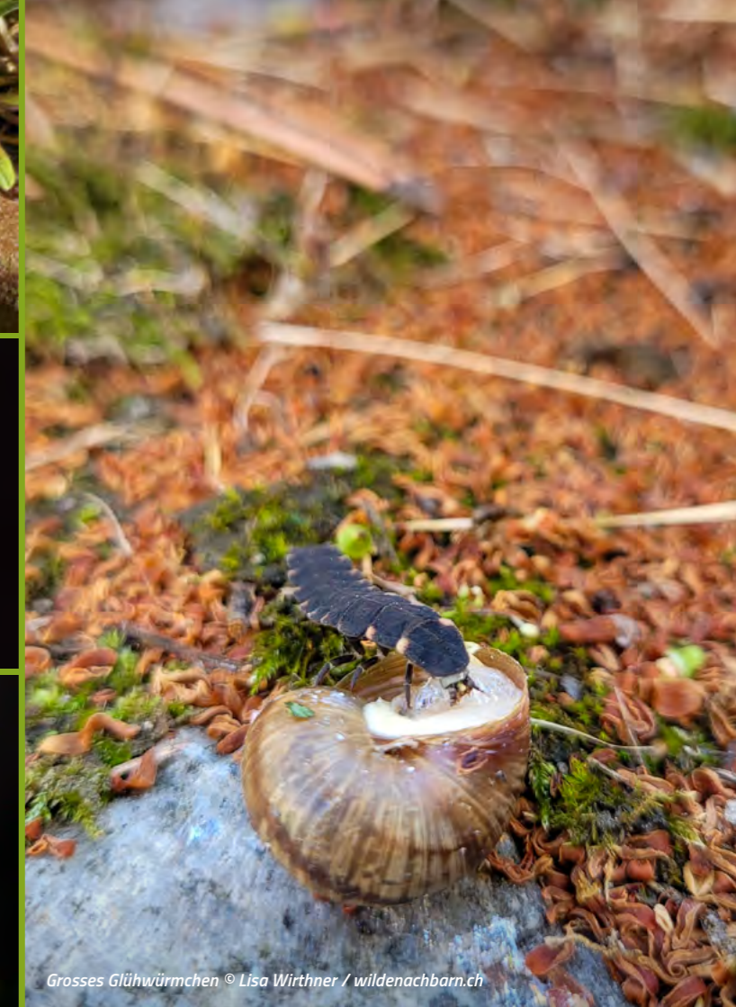
Grosses Glühwürmchen